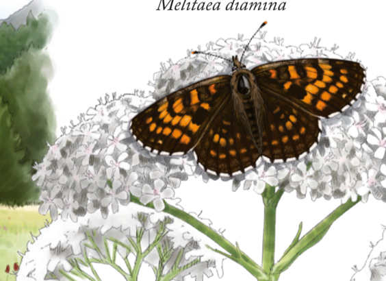
Damer de la valeriana Melitaea diamina