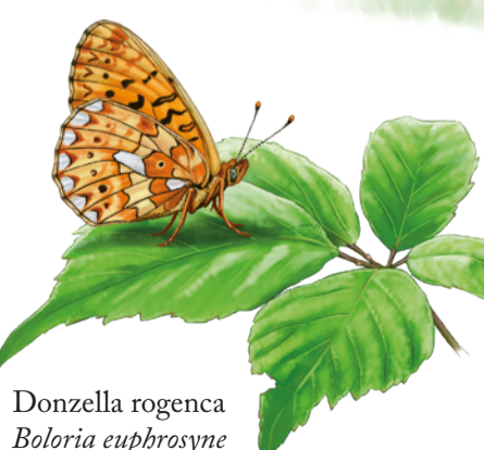
Donzella rogenca Boloria euphrosyne