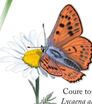
Coure tornassol Lycæna alciphron