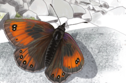
Muntanyesa de tartera Erebia gorge