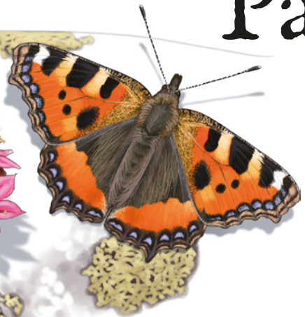
Papallona de les ortigues Aglais urticae