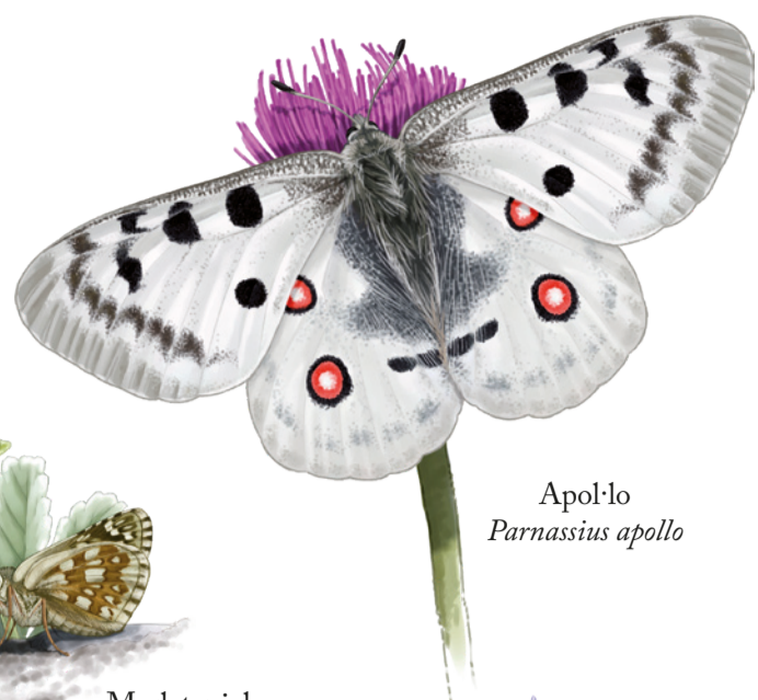
Apol·lo Parnassius apollo