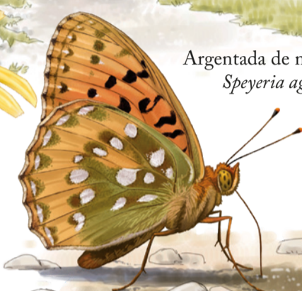
Argentada de muntanya Speyeria aglaja