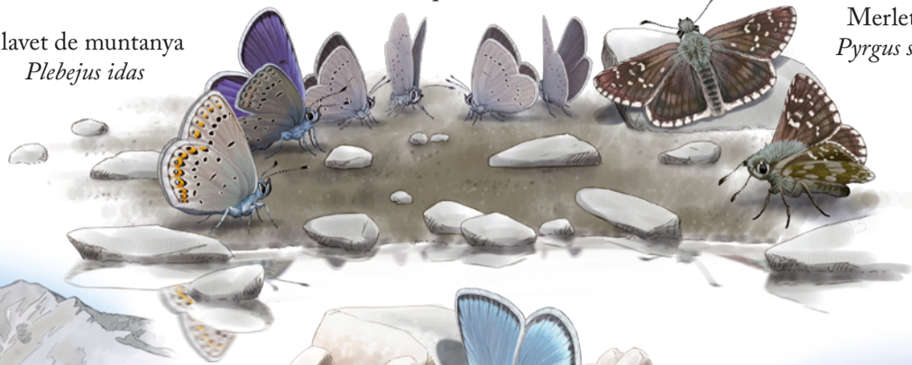
Merlet olivaci Pyrgus serratulae