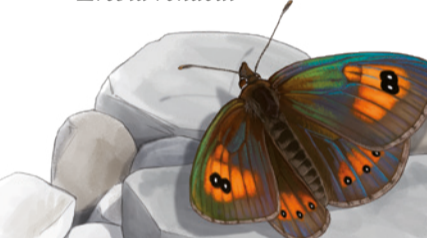
Muntanyesa grisa bessona Erebia rondoui