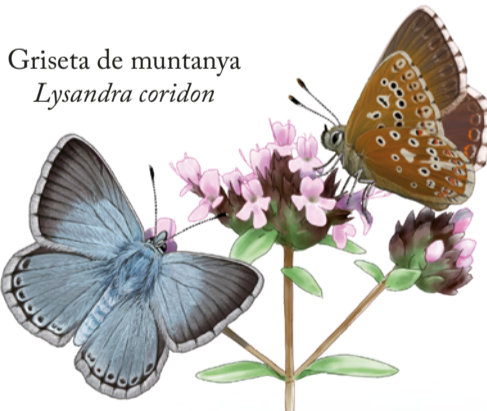
Griseta de muntanya Lysandra coridon