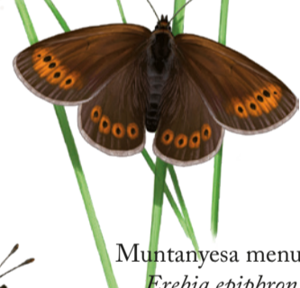
Muntanyesa menuda Erebia epiphron