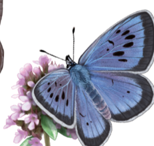
Formiguera gran Pbengaris arion