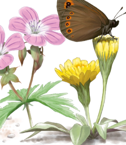
Muntanyesa de mollera Erebia oeme