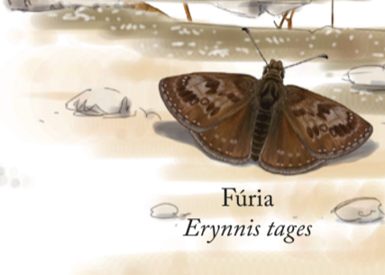
Fúria Erynnis tages