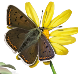
Coure fosc Lycæna tityrus