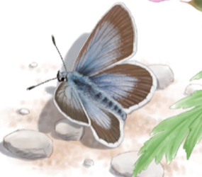
Moreneta grisa Aricia nicias