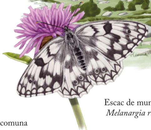
Escac de muntanya Melanargia russiae