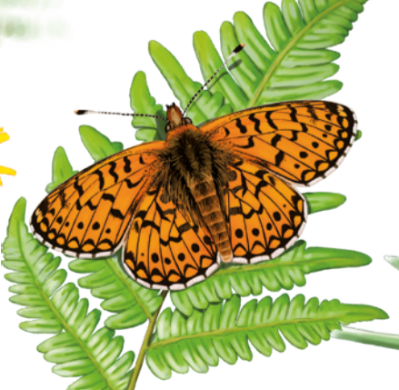
Donzella bruna Boloria selene