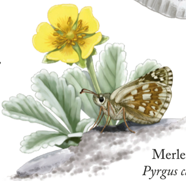
Merlet reial Pyrgus cartbami