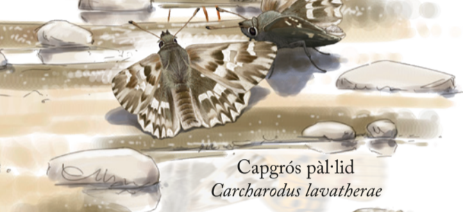
Capgròs pàl·lid Carcharodus lavatherae