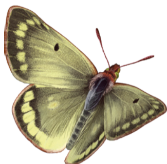
Safranera alpina Colias phicomone