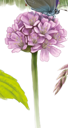
Cobalt Cyaniris semiargus