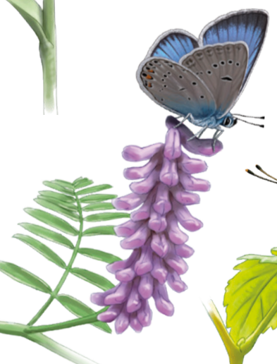
Blaveta de la garlanda Polyommatus amandus