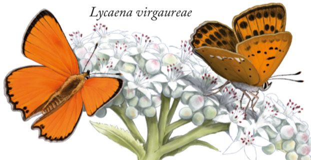
Coure roent Lycæna virgaureae