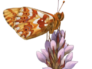
Donzella alpina Boloria pales