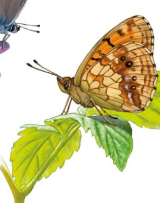
Perlada europea Brentibis ino