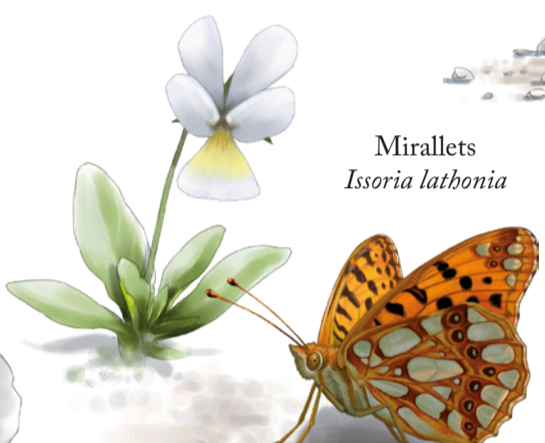
Mirallets Issoria latbonia