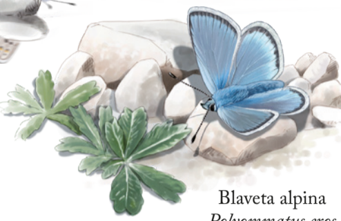
Blaveta alpina Polyommatus eros