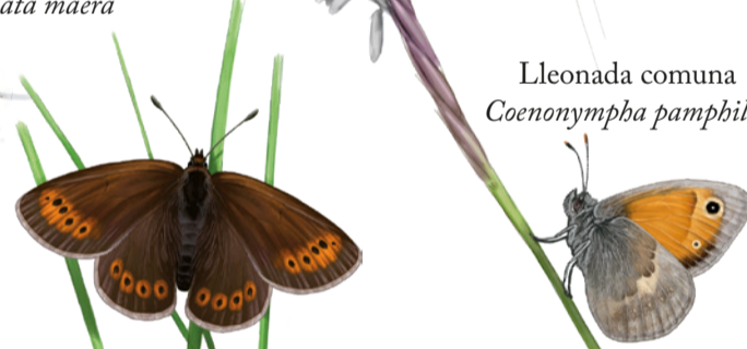
Leonada comuna Coenonympha pamphilus