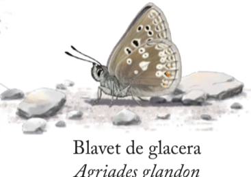
Blavet de glacera Agriades glandon