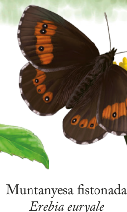
Muntanyesa fisonada Erebia euryle