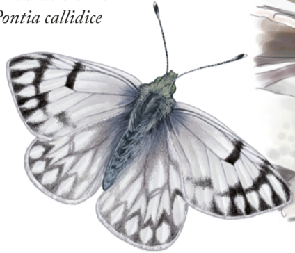
Pontia dels cims Pontia callidice