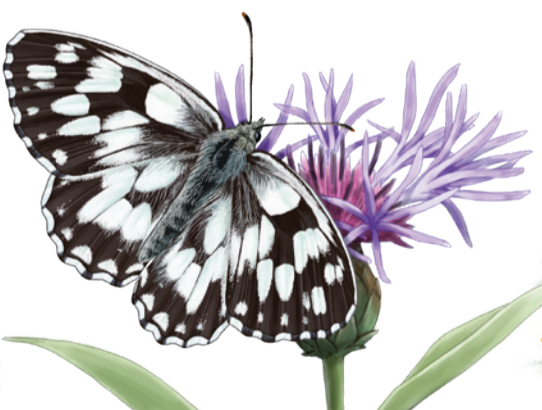
Escac aranès Melanargia galathea